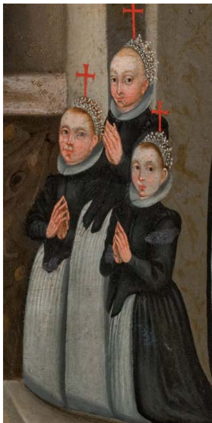
Fig. 5. Tre unge piger klædt til kirkegang i sorte trøjer, sorte skørter og hvide forklæder. Epitafium fra 1621 over ukendt familie i Næstved Sct. Peders Kirke.

I 1600-årenes skifter støder vi på en mængde forskellige dragtbetegnelser for mænds og kvinders klæder. Dragtstykkerne er ikke opskrevet i skifterne efter funktion, det er således ikke angivet, om de omtalte dragtstykker var til hverdag eller fest. Alligevel kan man