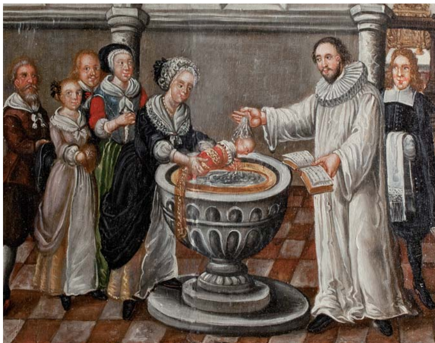
Fig. 8. Døb. Dåbsfølget tæller personer af forskellig stand, forrest gudmoderen (måske moderen) i opfæstnet kjole, også kaldet opstukken klædning eller manteau og dertil kniplingsbesat hovedtøj. Bag hende en kvinde, måske ammen, iført blå snørliv og grønt skørt, sort hue og hvidt lin. Altertalemaleri fra 1689, Holme Olstrup Kirke.

Trøjer båret sammen med skørt var almindelig påklædning for kvinder af alle sociale lag 1600-årene igennem. Selv da kjolen mod slutningen af århundredet var blevet mere populær end trøje og skørt, havde de fleste kvinder en eller flere trøjer. De var hyppigst sorte, men der fandtes også mønstrede og kulørte trøjer, flest røde, blå eller brune. Anne Bruuns i Vordingborg, enke efter en skriver, havde ved sin død i 1637 en