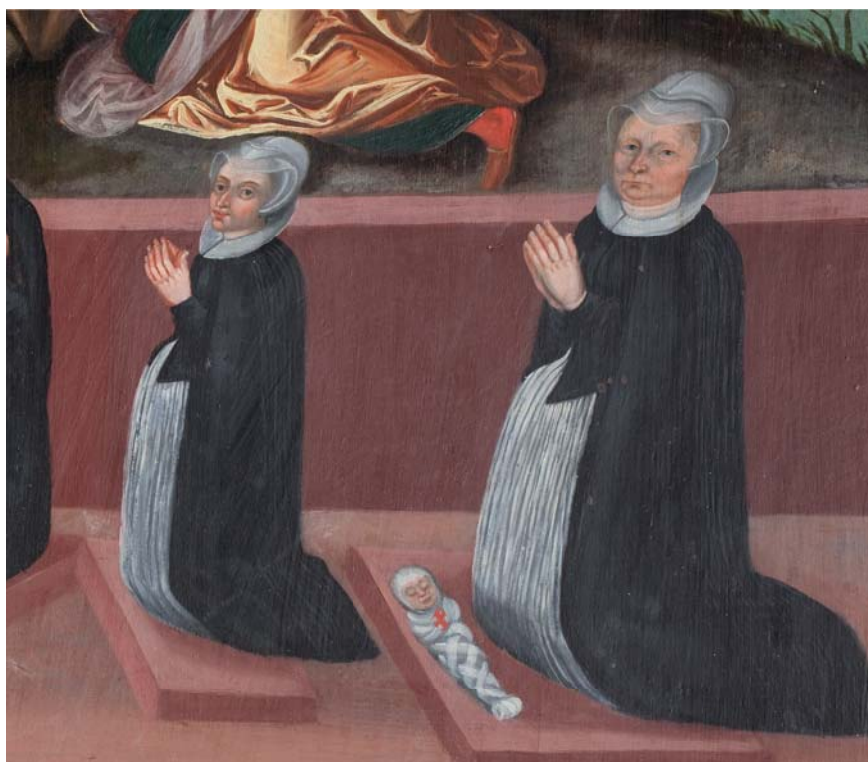
Fig. 9. To borgerkoner iført sorte kirkegangsdragter og hvide tæt-plisserede forklæder. Epitafium over ukendt familie, malet omkring 1620, Næstved Sct. Mortens Kirke.