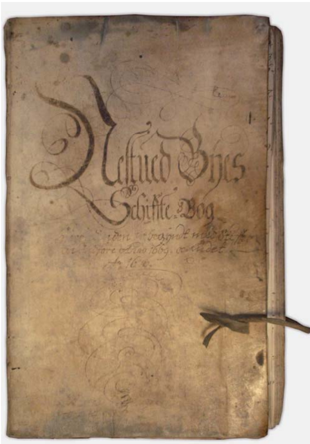
Fig. 1. Skifteprotokol fra Næstved 1676. På bogen står: "Nestued Byes Schiffte Bog". Landsarkivet.