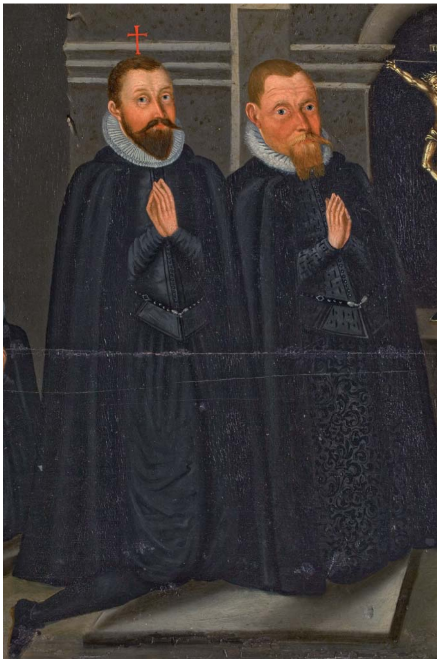
Fig. 14. To borgerlige mænd iført korte, stramme trøjer med lille skød og bælte i livet, den enes skåret i tunger, en såkaldt udhugget trøje. Dertil brede vide bukser, den enes glatte, den andens mønstrede. Epitafium over ukendt familie fra ca. 1620'erne, Næstved Sct. Peders Kirke.