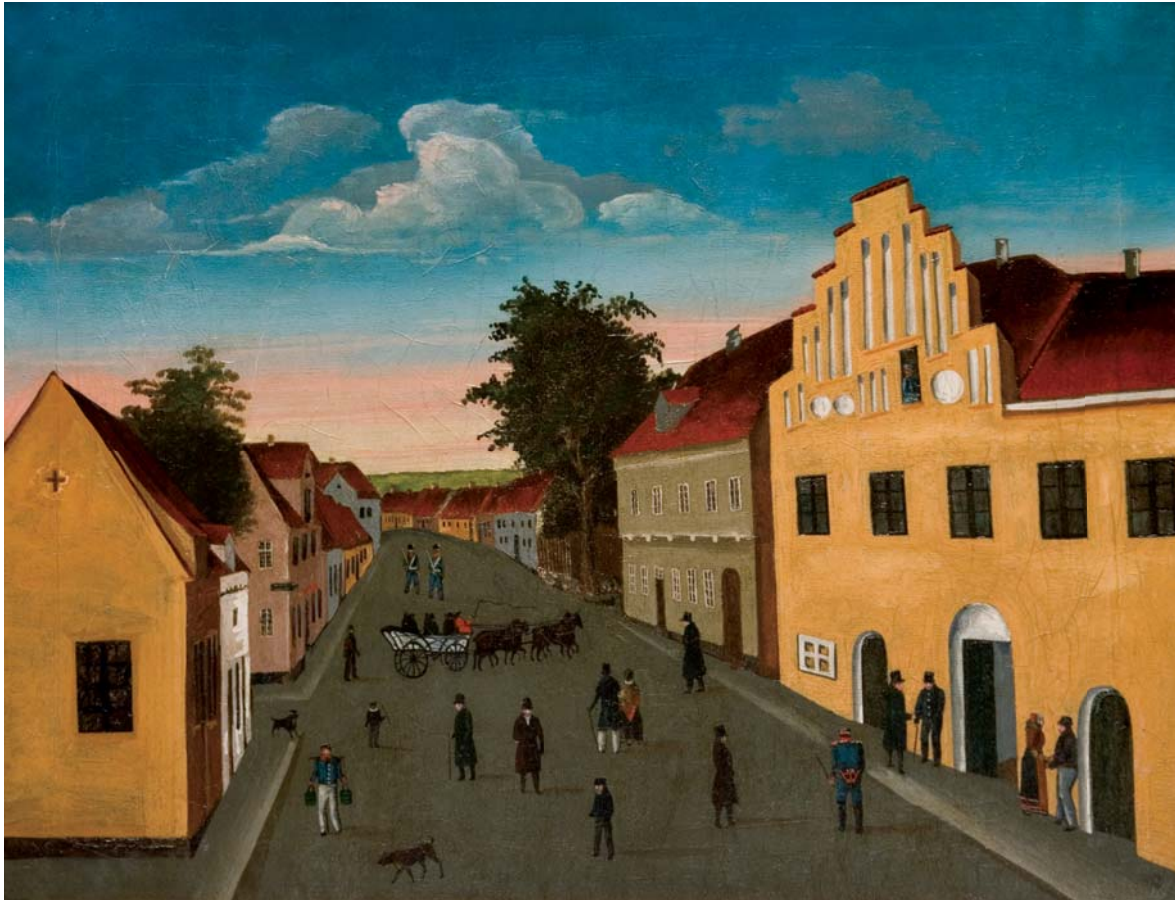
Ukendt maler: Kirkepladsen og Møllegade, 1830erne olie på lærred, 50 x 39 cm NÆM 2003:012, købt på auktion