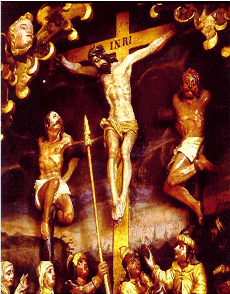
Korsfæstelsen. Detalje fra altertavlen i Hammer Kirke.