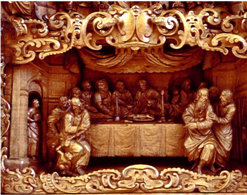
Detalje fra altertavlen i Næstved, Sct. Mortens Kirke, 1667.