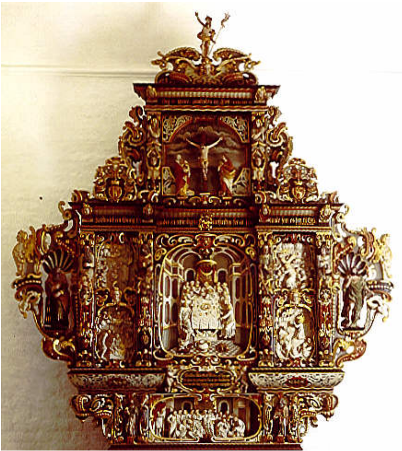
Vester Egesborg Kirkes altertavle, 1655.