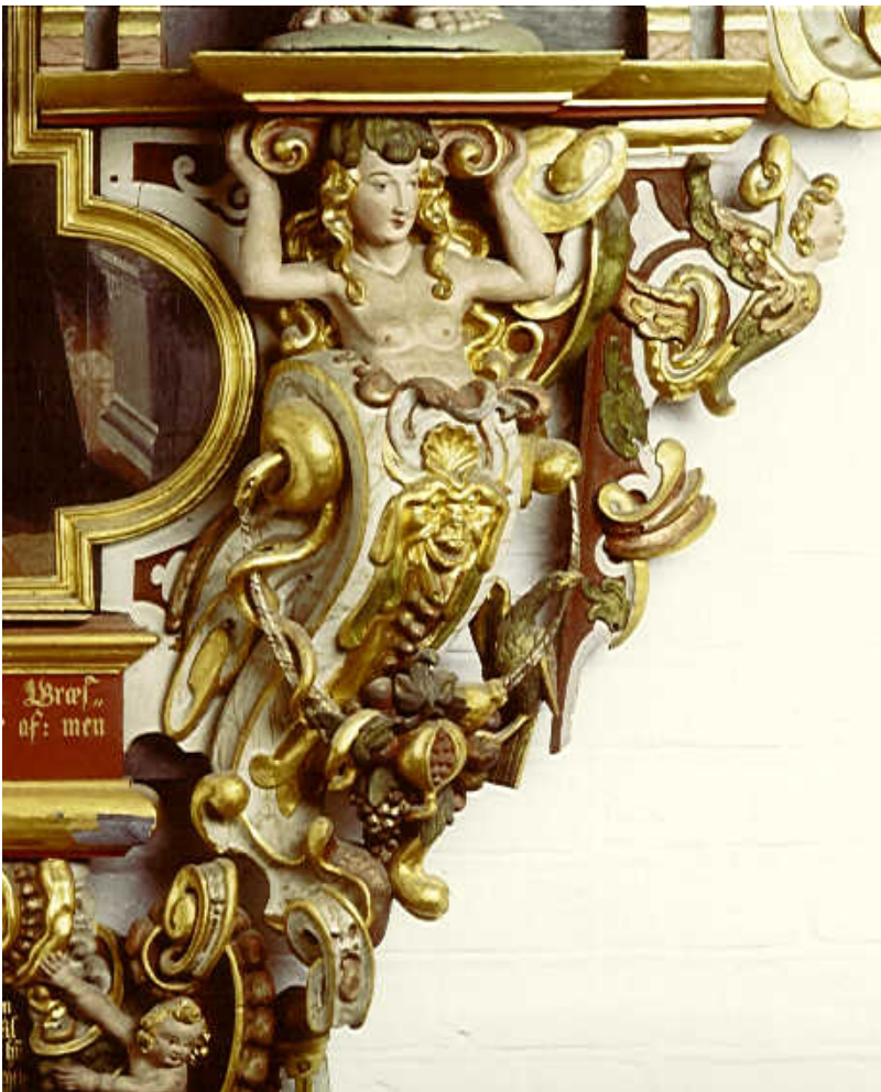
Herme fra epitafium i Præstø Kirke, ca. 1645.