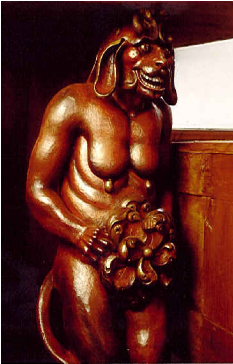
Vejlø prædikestol. Bærefiguren "Slattenpat", ca. 1669.