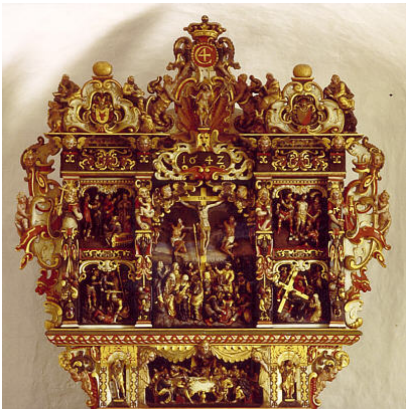
Altartavlen i Hammer Kirke, 1642.