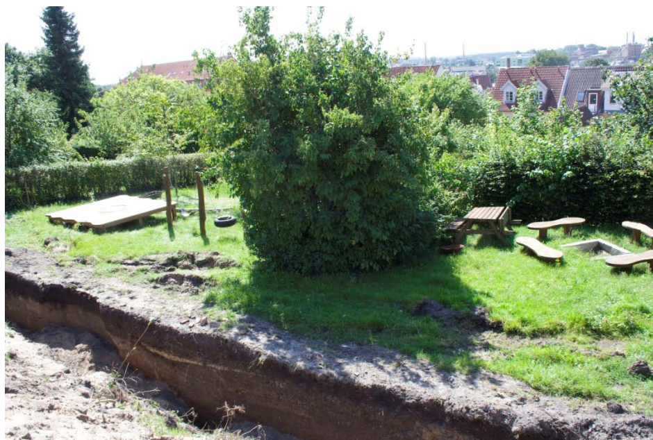
Figur 3: Grøft I med udsigt ud over byen.

Undergrunden består af sand, til tider gruset, i gule, orange og brune nuancer.