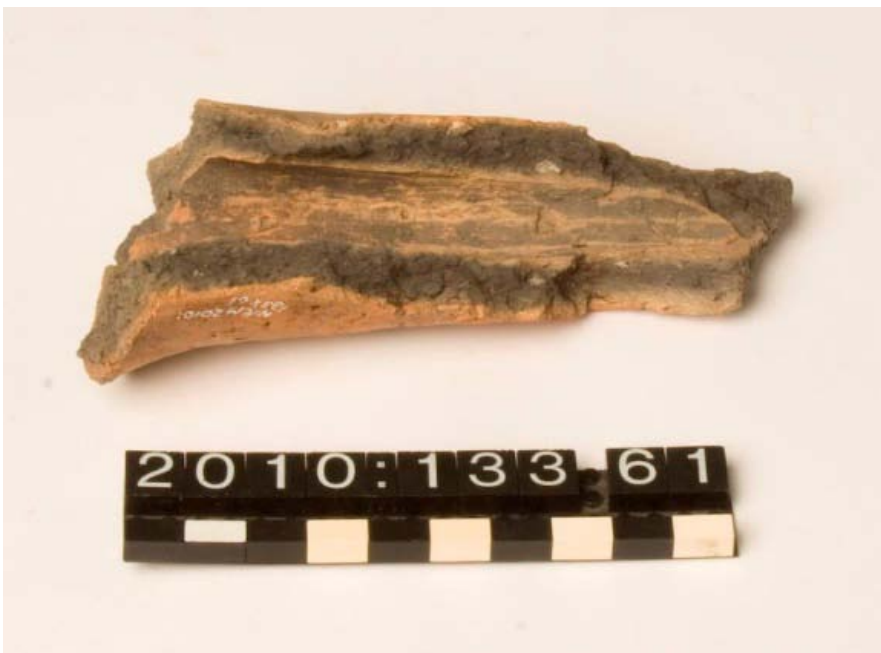
Figur 6: X61 Støbetragt.