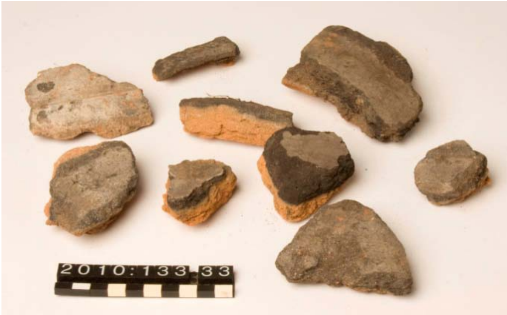
Figur 5: X33 Støbeformdele med aftryk.

afrensning i Grøft II, III og IV. I de førnævnte lag, der alle ligger i sydøstdelen af byggegrunden, er også fundet brændt ler, trækul, slagge, dyreknogeter (nogle farvet irgrønne, hvilket tyder på tilstedeværelse af kobberlegering i jorden), et fragment af en sortglaserede kachel samt keramik; herunder hornbemalede- og stjernepotteskår. Lagene dateres til 1600-tallet. Støbeformdelene havde aftryk af den gryde, kande eller klokke, der er blevet støbt med dem.