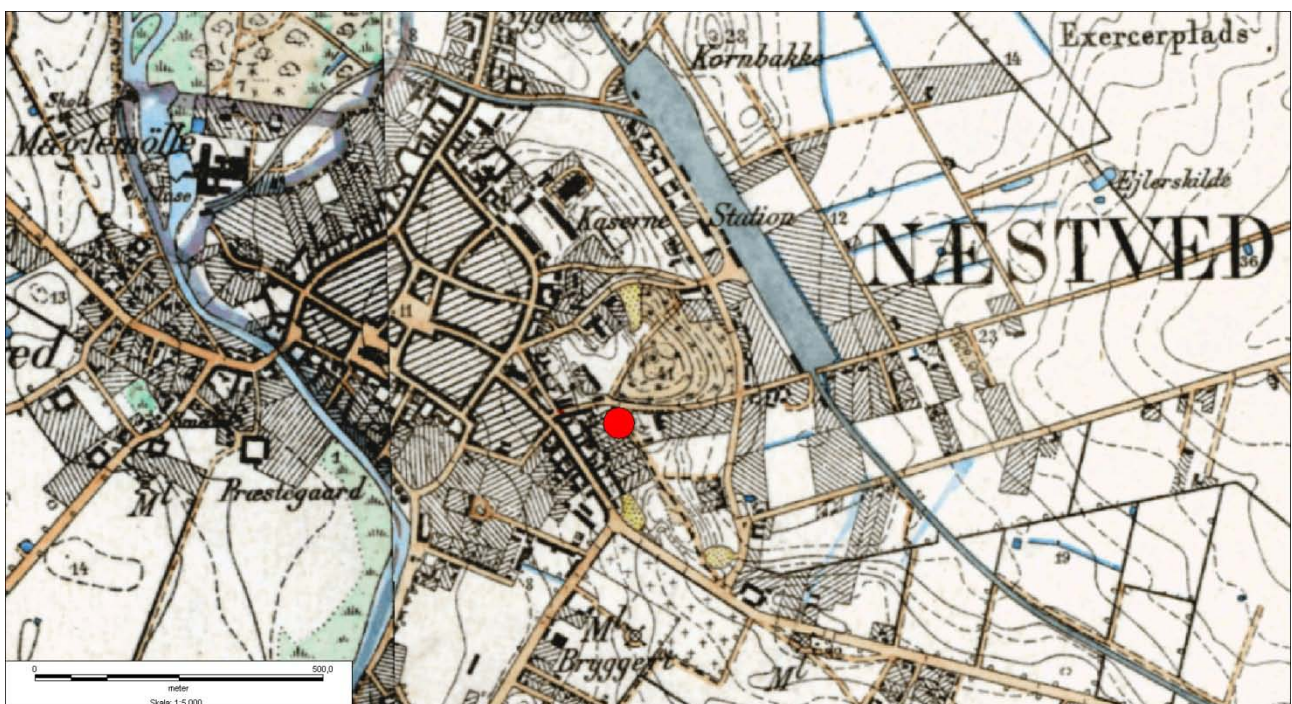
Figur 1: HøjeMålebordsblade med placering af undersøgelsesområdet.

Byggegrunden Østergade 13, Sb.nr. 050707-184, befinder sig indenfor det udpegede kulturarvsareal for middelalderbyen Næstved, ikke langt fra Sct. Mortens Kirke. Ca. 100 meter øst for udgravningsfeltet fandt man ved Amtsmanshaven i 1985 begravelser med resterne af 8 individer, der alle viser tydelige tegn på at være halshuggede (NÆM 1985:700, sb.nr. 050707-39). Ved mindre udgravninger og besigtigelser i området er fundet keramik og gruber fra 1600 tallet til nyere tid (NÆM 2000:105, sb.nr. 050707-145)