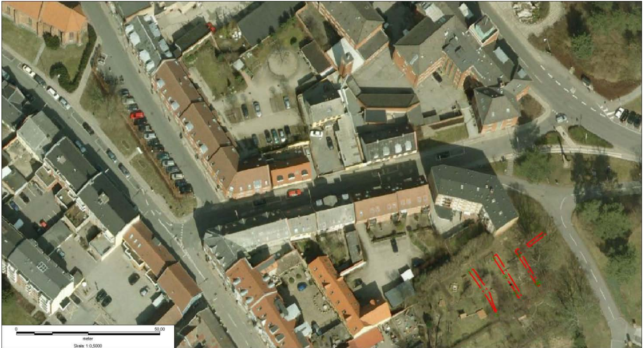
Figur 4: Luftfoto med grøfterne.