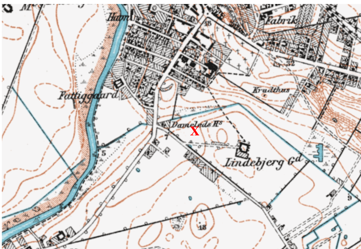
Lave målebordsblade 1900-1960. Kort og Matrikelstyrelsen. Krydset markerer Svingelen.