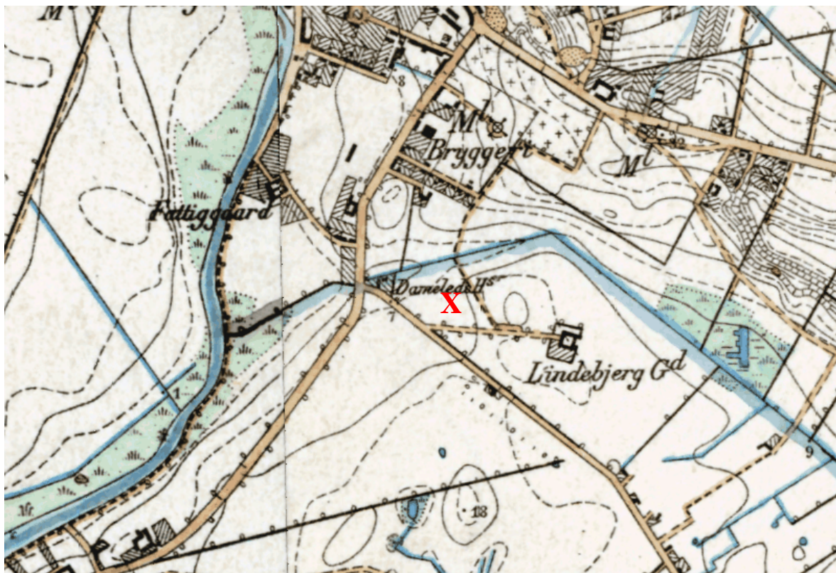
Lave målebordsblade 1842-1899. Kort og Matrikelstyrelsen. Krydset markerer Svingelen.