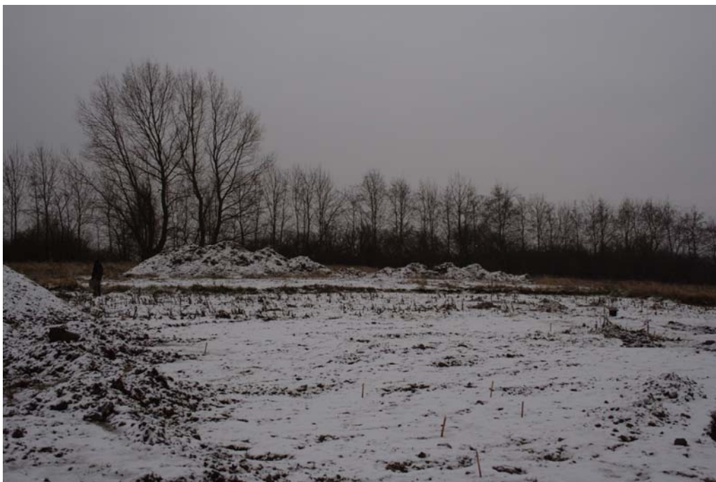
Selvom vinteren huskes som en af de varmeste i nyere tid, så bød den rent faktisk også på en smule sne

På næstvedegnen er bebyggelsen fra yngre jernalder generelt kun lidet kendt pga. intensiv dyrkning gennem århundreder. På Maglebjerg, få hundrede meter vest for Jeshøjgård, blev der for få år siden fundet en rig kvindegrav fra yngre romersk jernalder (se NÆM 2004:114), men uden at nogen samtidig bebyggelsen i nærområdet var kendt. På baggrund af dette var det af stor interesse at få belyst de massive anlægsspor på Jeshøjgård-arealerne.