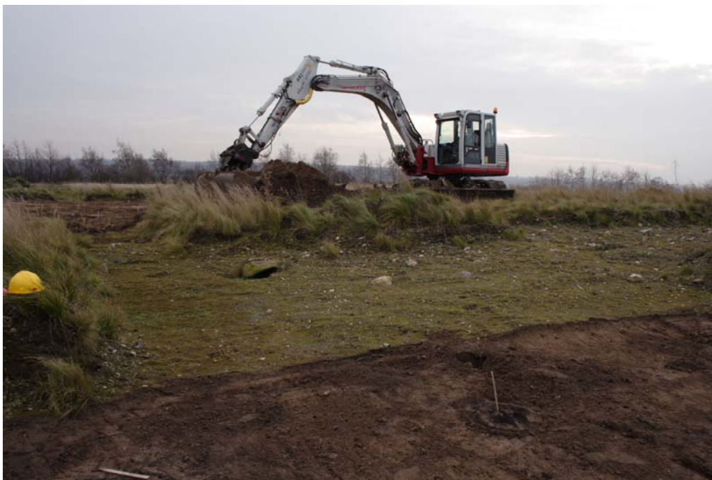
Omr. I under afrømningen – den grønne flade i forgrunden er en af de udvidelser, der havde stået åbne siden forundersøgelsen.

Område I + II blev gennemgået med metaldetektor, men uden fund af oldsager.