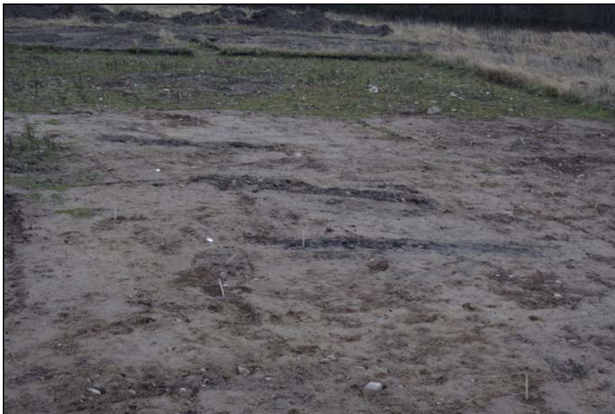
De lange kogegruberender på område III

Som på omr. I blev et udvalg af gruberne omkring og mellem de forskellige bygninger undersøgt, for at få mere information om gårdskomplekset. Men også ligesom på omr. I var resultaterne magre, trods organisk fyld var der meget få fund i dem, keramik såvel som knoglemateriale eller andet. Enkelte kogegrube lå spredt på feltet. En enkelt langstrakt kogegrube lignede anlæggene på omr. III (ses nedenfor). Et par andre kogegruber var af afrundet rektangulær form og relativt fladbundede. Studier fra Fyn tyder på, at denne form skal henføres til den ældre jernalder (indtil 400 e.Kr.).