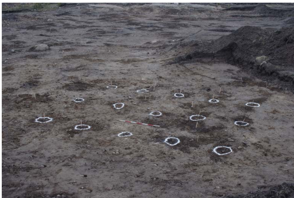
K1 – en ladebygning på stolper, stolpehullerne markeret på fladen før undersøgelse