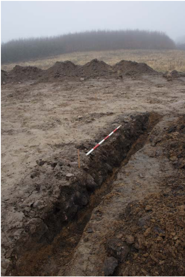
Kogegruberenderne var tæt pakket med brændte sten.