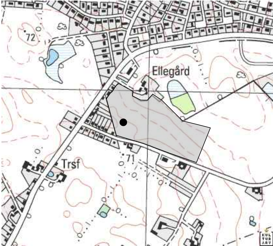
● = Kogsstensgruber