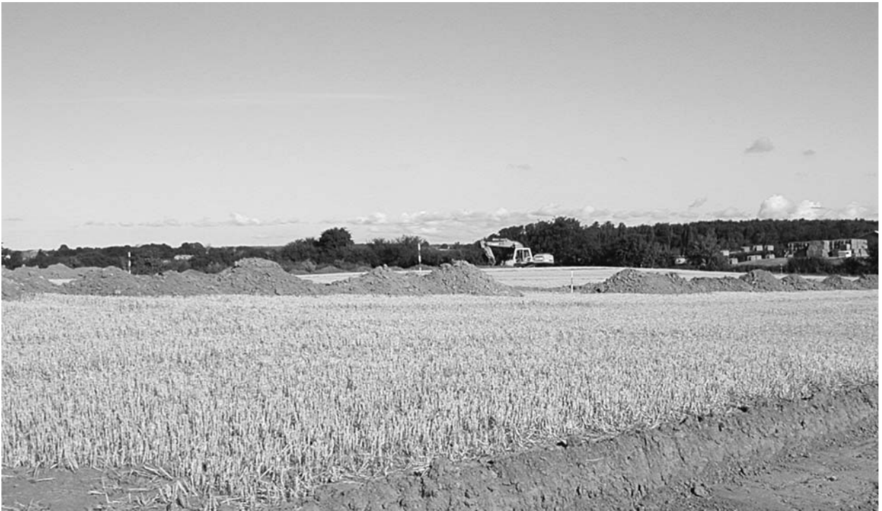
Afrømning af muld omkring felt A (set fra sydøst).