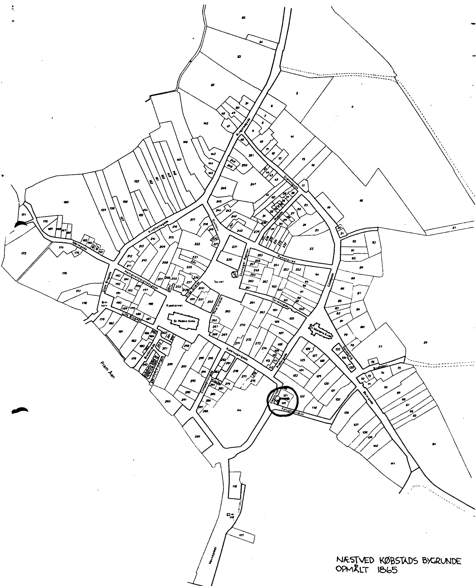
NÆSTVED KØBSTADS BYGRUNDE OPMÅLT 1865