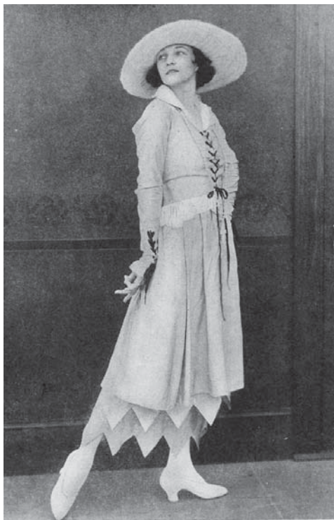
Damemode under 1. verdenskrig