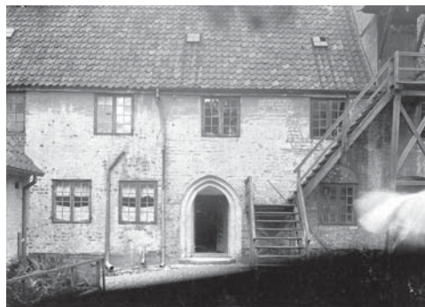
Helligåndshuset før restaureringen set fra Haven. Foto ca. ved foreningens start

Næstved Museumsforening Ringstedgade 4b 4700 Næstved