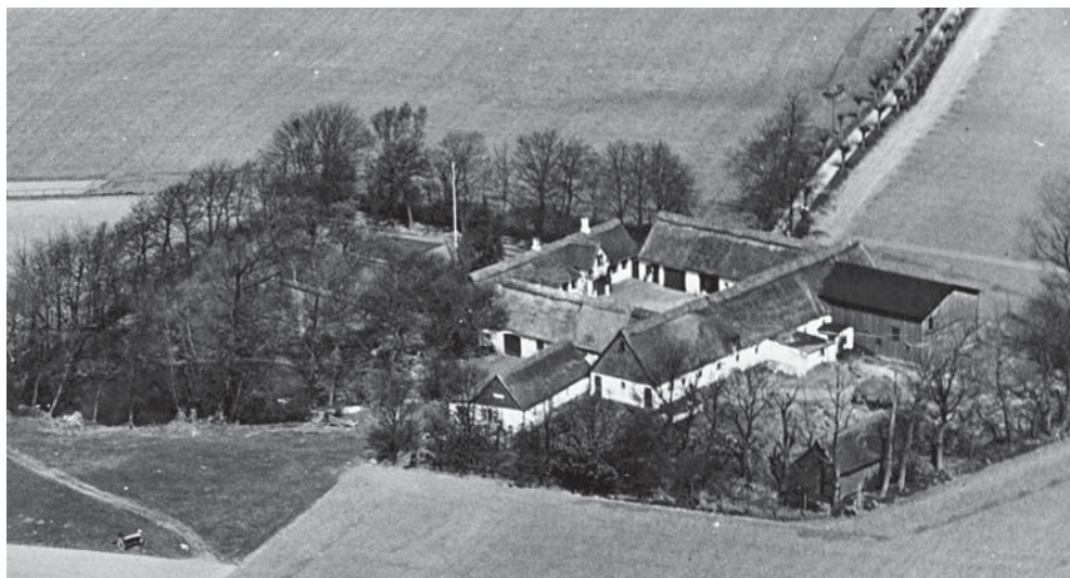
Gedebjerggaard, Lille Næstved

genstande, man som museum har fundet det vigtigt at indsamle til museet. I udstillingen vil man blandt andet kunne se nogle af de såkaldte huenakker, som kvinderne gik med i 1800-tallet. Vi har fundet huenakker frem, der er særlige for Næstvedegnen. Man vil også kunne se genstande fra Gedebjerggaard i Lille Næstved. Museet har knap 400 genstande fra gården, heriblandt miniaturemodeller af landbrugsredskaber. Vi viser også genstande fra udgravningen af Bredstræderne, der lå bag ved Boderne ned mod Susåen, og som blev revet ned i 1963. Det meget righoldige arkæologiske fundmateriale fra udgravningen, hovedsageligt enorme mængder keramik,