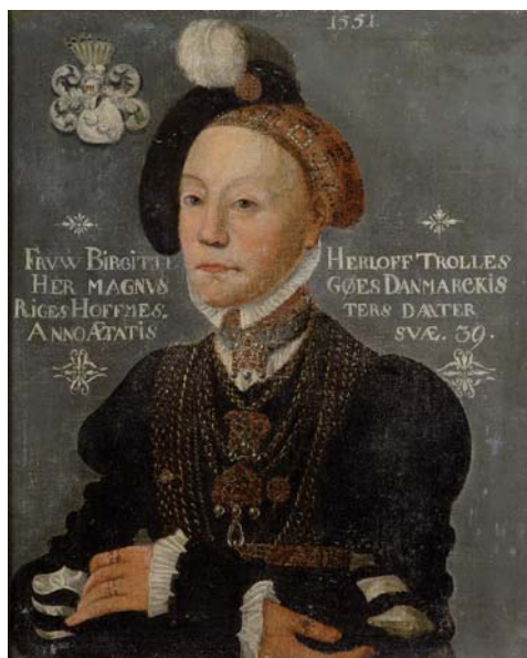
Herluf Trolle (1516 - 1565) og Birgitte Gøye (ca 1511 - 1574). Maleri 1551, Herlufsholm.