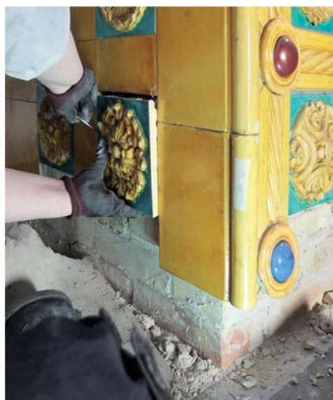
Fotos fra nedtagningen. Bevaring Sjælland.

Bevaring Sjælland er stort set færdige med at nedtage alteret, og på billederne kan man se processen.