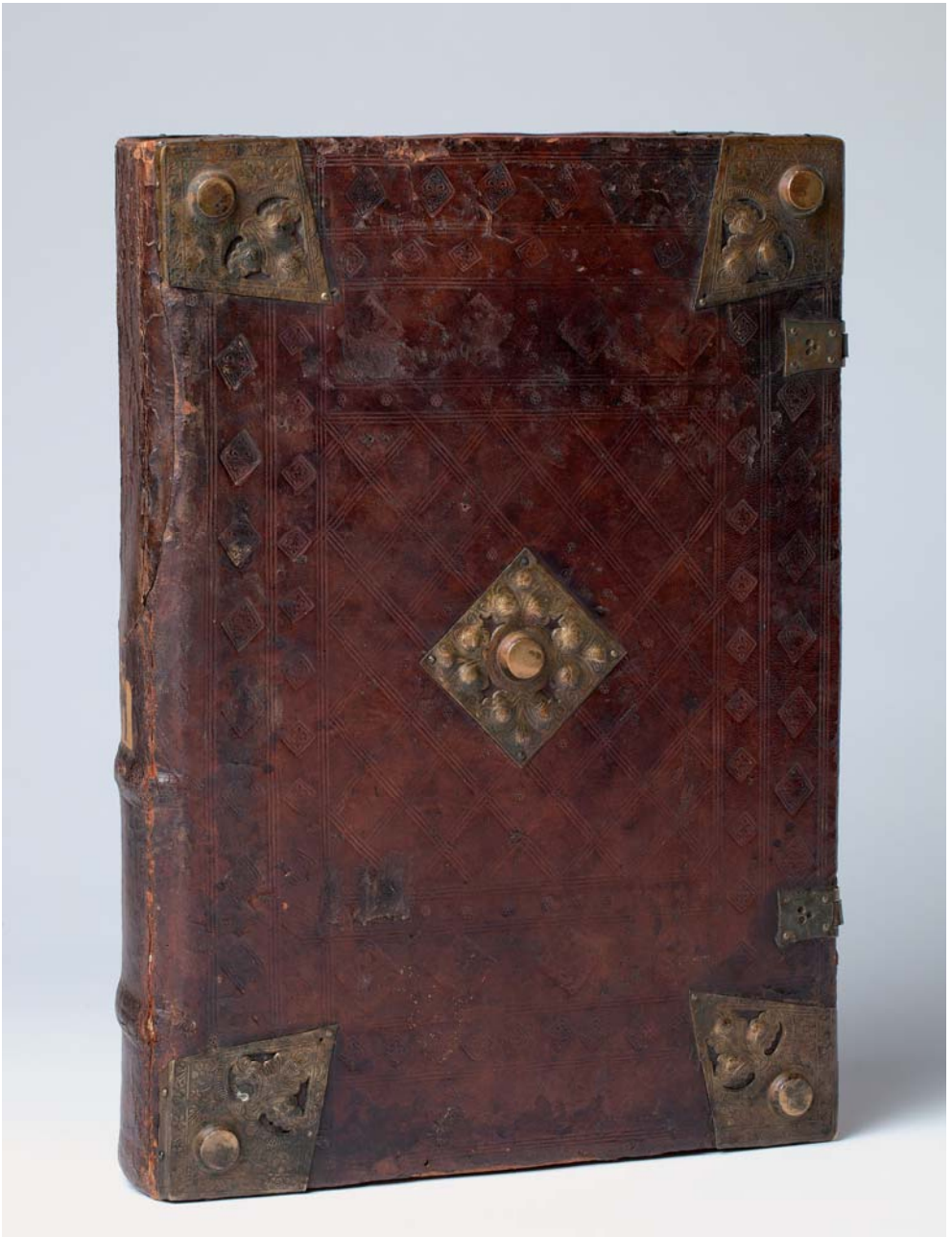
Bog (nr. 2) i Birgitte Gøye og Herluf Trolles bogsamling, der er det eneste kendte skrift, der stammer fra Gråbrødre Kloster i Næstved. Klostret lå hvor Axeltorv er i dag.