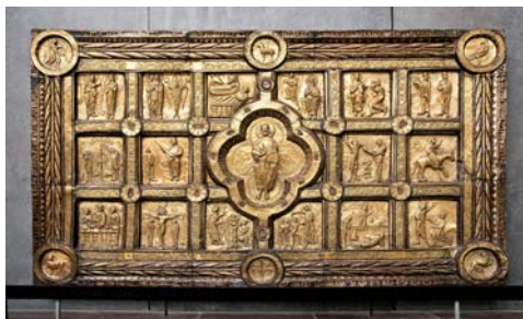
Gyldent alter fra Ølst Kirke, Randers.

Men i Kählers udgave er det naturligvis udført i keramiske fliser. Den gule farve på alteret erstatter guldets, og i stedet for de halvædelsten og bjergkrystaller, der var på de gyldne altre, er der her sat farvede knopper ind. På nogle af dem er der den røde lustre, som Kähler vandt berømmelse for på verdensudstillingerne i 1800-tallet.