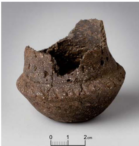
Lerkar fra ældre jernalder fundet ved den nordlige omfartsvej

Så der foregår mange ting rundt omkring i Næstved Kommune. Kommer I forbi en af vores udgravninger, er I meget velkomne til at stoppe og få en god snak.