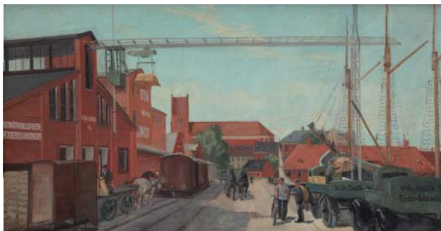
Albert Svendsen pinx.

Med anlægget af Kana-len og Næstved Ny Havn i 1938 fik Næstved genetableret den historiske forbindelse med verdenshavene, og Næstved blev en moderne havneby. Foredraget beskriver udviklingen fra den pulserende havn i 1940'erne og 1950'erne til moderne tiders potentiale. Hvilke muligheder for udvikling ligger der og venter i havnens bassiner? Kan vi flytte varetransport fra lastbiler og tog tilbage til skibe? Eller ligger havnens fremtid i helt andre funktioner?