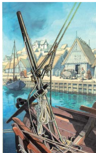
Charlotte Clante del.

Fra Næstveds tidligste tider var Susåen en åhavn, en port ind i Næstved By, som den strakte sig på begge sider af åen. Fra den tidlige middelalder lå Store Næstved med torvet, sognekirkerne og de mange bygårde og Lille Næstved med mange andre bygårde. Til sammen dannede de to bydele torvekøbingen og senere købstaden Næstved. Til overflod tjente købstaden Præstø som Skovklosters og Næstveds ladeplads mod øst, dvs. mod de årlige markeder på den skånske Skanør-halvø, datidens Frankfurtermesser! Foredraget beskriver udviklingen op gennem historien, herunder også de strenge tider, hvor havnen langsomt dels sander til, dels fyldes ved aktiv, de-