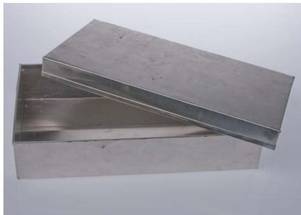
Per Lütkens madkasse NÆM 2204x5473.

Tak til den store gruppe frivillige, som deltager i arbejdet. Der er venteliste!