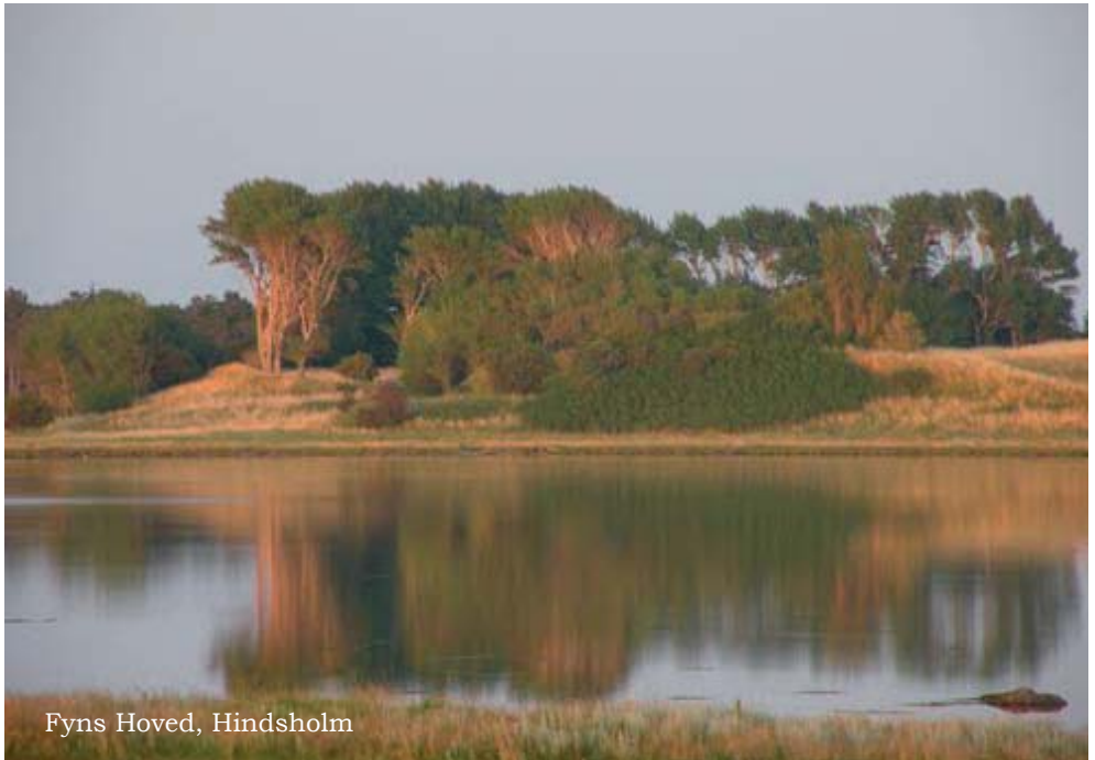
Fyns Hoved, Hindsholm

Turen tager udgangspunkt i parkeringspladsen ved Rådmandshaven, hvor vi også lander igen. Bussen afgår kl. 9 og hjemvender ca. kl. 18.