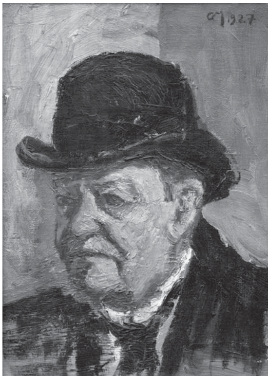
Gunnar Mortensen: Herre med bowler, 1927

Samlingen af portrætter rækker tilbage til tiden omkring 1700 og afspejler blandt andet udviklingen i dragt og hårmode. Samtidig viser den hovedtendenser i kunsten i de pågældende 300 år gennem barok og rokoko, empire og guldalder, naturalisme, impressionisme, ekspressionisme og modernisme.