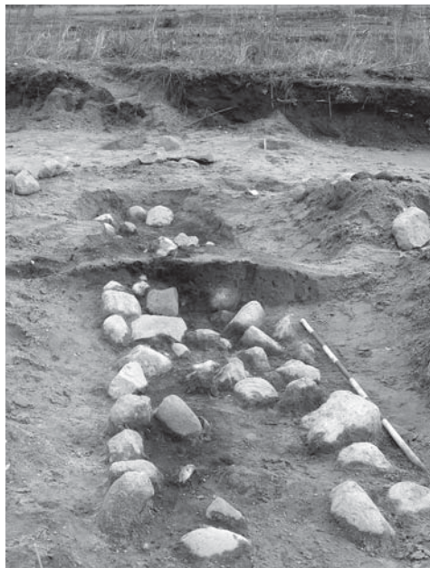
Grav fra yngre stenalder. Enggården ved Holsted Allé.

adskillige hundrede anlæg, som synes at være spor efter aktivitet i yngre stenalder og bronzealder, ca. 4500 og ca. 500 f. 0. Velbevarede potteskår fra ca. 4000 f. 0 viser, at her færdedes nogle af de første generationer bønder på arealerne langs Susåen. Fundet fra den tidlige bondestenalder er et af de første, som museet har haft lejlighed til at undersøge. Et aflangt anlæg fyldt med sten, potteskår og sodet fyld kan måske være en grav. Omkring anlægget ses endvidere flere stolpehuller, som kan være spor efter en overbygning over graven, en form for dødehus. I andre anlæg er fundet keramik og brændte knogler, som sandsynligvis stammer fra kremerede begravelser fra ca. 500 f. 0. Undersøgelserne ved Enggården er endnu ikke afsluttet, og meget kan endnu dukke frem.