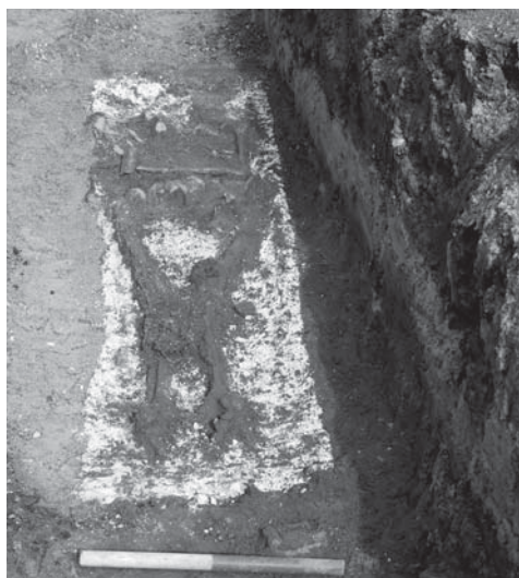
Grav på et lag af læsket kalk. Set fra fodenden i øst.

gården var i funktion fra før 1135 indtil 1820'erne. Der blev hjemtaget et større antal løse knogler samt 10 skeletter, hvoraf et skelet efterfølgende skal analyseres antropologisk. Begravelserne er dateret på grundlag af gravenes placering og fundmateriale i gravene til slutningen af 1600-årene samt 1700-årene. Der var gravgods tilstede i form af kysespænde, hårnåle, ligklædenåle, håndbuket af metal, kistehåndtag o.l. ligesom en kiste indeholdt et lig liggende på læsket kalk. Kalken blev ofte anvendt, når en person var død af en smitsom sygdom.